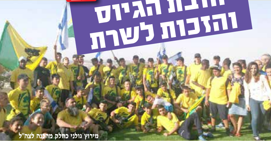
מירוץ גולני כחלק מהתנה לצה"ל

שירות בצה"ל, מעבר להיותו חובה, הינו שלב משמעותי, מכין ובונה בחייו של כל אזרח ישראלי. אנו שואפים שכמה שיותר מתלמידינו יתגייסו לשירות משמעותי בצבא, כל אחד לתפקיד שמתאים לו – שיתרום לו והוא יתרום באמצעותו. לכן, אנו מפעילים תכנית הכנה לצה"ל שמטרתה מוכנות נפשית ומנטלית לשירות, אמונה עצמית, מסוגלות ונכונות. תכנית ההכנה שלנו לצה"ל, פועלת בשני מישורים במקביל: במישור היומיומי שכולל ליווי אישי של כל התלמידים שלנו שנמצאים בתהליכי גיוס – הכנה לצו ראשון וליווי ללשכה, ייעוץ בקבלת החלטות לגבי תפקידים, הסברה, עידוד וכו' ובהפעלת מגוון פעילויות גדולות שמטרתן עידוד לגיוס משמעותי – ימי שיא, מור"קים, שיחות עם בעלי תפקידים ומפגשים עם חיילים, כל זאת כדי לספק ידע ולהגביר מוטיבציה לשרות. כמורה חיילת בבית הצייר, בעיני, תהליך ההכנה לגיוס לצה"ל הוא משמעותי מכיוון שהוא פותח בפני הנערים עולם עם אפשרויות