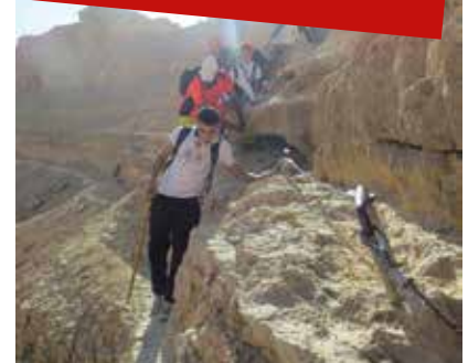
מסע לנגב מעלה פלמח

לפני כארבע שנים התחלנו במסגרת בית הספר פרויקט ייחודי הנקרא "פרויקט הישרדות", ע"ש עמנואל אביטבול ז"ל. מטרת הפרויקט ליצור דרך נוספת להתמודדות באמצעות מפגש בין הנערים לטבע ולחוויות מאתגרות ומעצימות. כחלק מהפרויקט אנו יוצאים פעם בשבוע משטח בית הספר לחורשה הקרובה ומתנסים בפעילות הישרדותית בשטח, טיפוס, עבודת צוות ועוד. מלבד הפעילויות בחורשת הירח יצאנו השנה