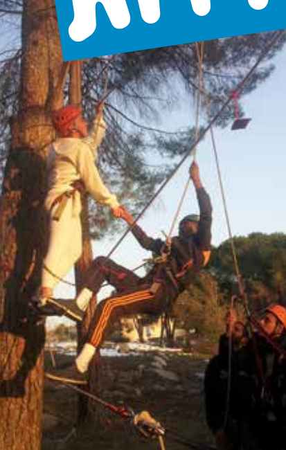
תלויים אחד בשני