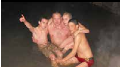
טובלים בעין קובי