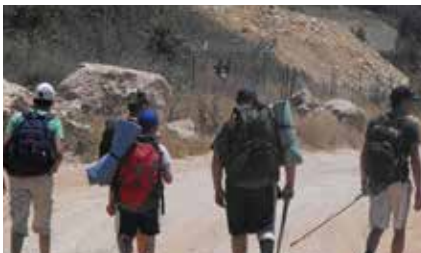
מסע עם ציוד על הגב

הקבוצה, שהחליטה לכנות עצמה בשם "המורעלים", פועלת במהלך שלוש השנים האחרונות. השנה מדריך את הקבוצה אדם דה נגה ממרכז "יעלים" שבעין יעל . אדם לימד את הקבוצה קשרים חזקים בחבל כדי לסייע בחילוץ אדם בשטח, בישולים שונים במדורה ובגחלים, שיטות הסוואה בשטח, מציאת עקבות והסיפור