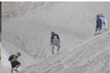
כובשים את הר הנגב