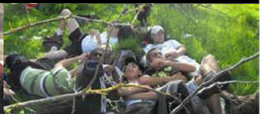
נחים ליד המעיין בטיול