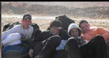
מוקדם בבוקר במדבר